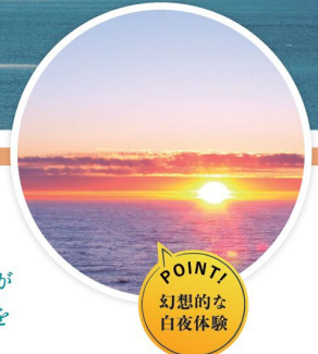
POINT! 幻想的な 白夜体験

神秘的な ブルーが重なり合う、アラスカフィヨルド。荘厳な静けさが訪れるものを包み込みます。そんなアラスカの氷河地帯を目前で見ることができるのは、クルーズならではの特権です。豊かな自然と隣り合う北米大陸の国々への訪問をハイライトに、生命力溢れるアフリカの国々や数々の世界遺産が待つヨーロッパ、太陽のきらめく中米を贅沢に堪能します。