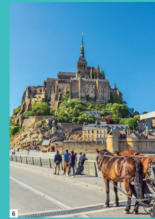
世界遺産が待つヨーロッパと 初夏の北欧を訪れます。