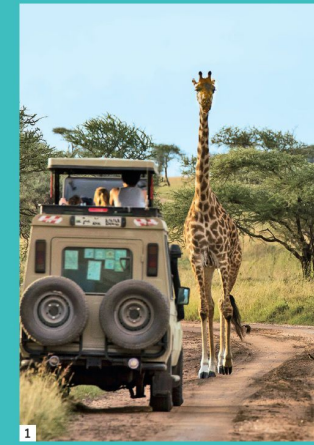
南半球の大自然が待つ 美しいアフリカ大陸へ。