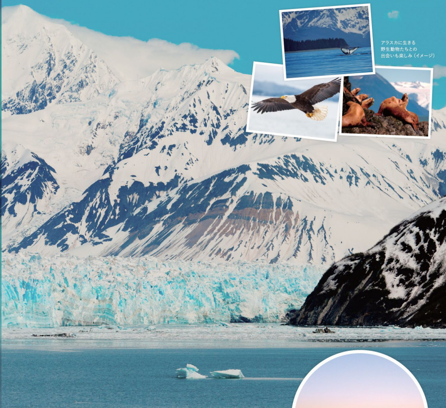
アラスカフィヨルド(米国)

ピースボート地球一周の船旅 2024年4月 初夏限定、雪解けの大自然に出会う （アフリカ・ヨーロッパ&アラスカコース）