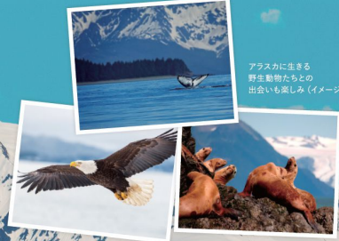
アラスカに生きる野生動物たちとの出会いも楽しみ(イメージ)

2024年4月13日(土)~2024年7月26日(金) [横浜発着105日間] 2024年4月14日(日)~2024年7月27日(土) [神戸発着105日間]