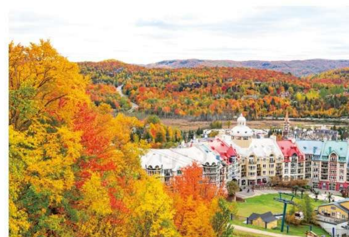
カナダの紅葉のハイライト ローレンシヤン高原

高原リゾートとして人気のローレンシヤン高原・トレンブランビ レッジでは、ゴンドラからの絶景はもちろん、ショッピングやレ ストランでのお食事も楽しめます。