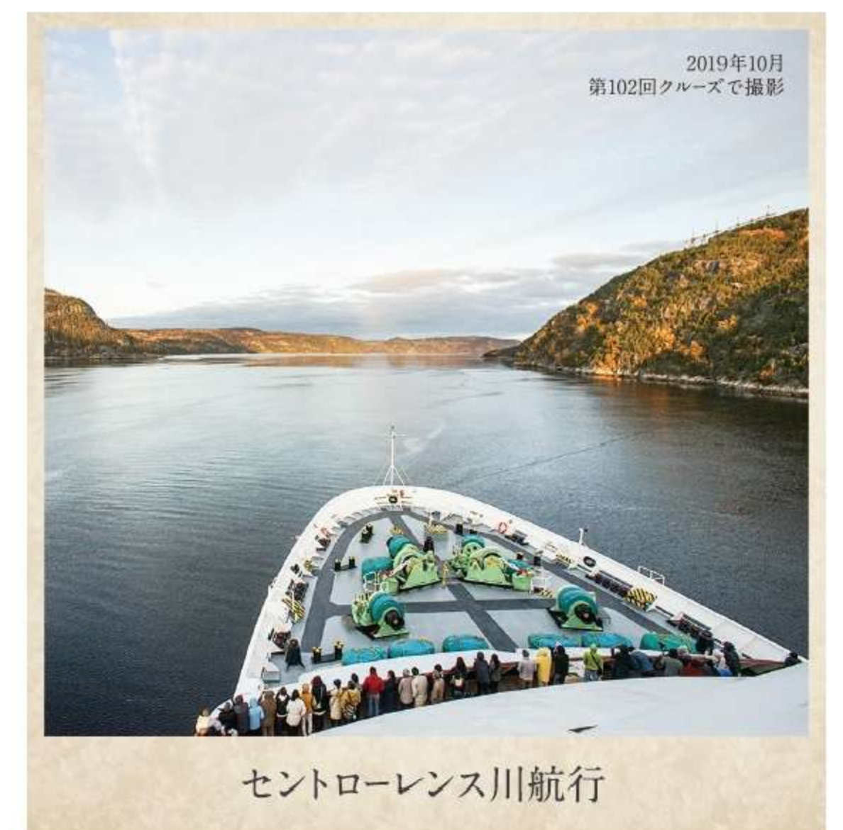
セントローレンス川航行

高原リゾートとして人気のローレンシヤン高原・トレンブランビ レッジでは、ゴンドラからの絶景はもちろん、ショッピングやレ ストランでのお食事も楽しめます。