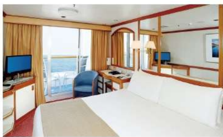
スタンダードバルコニー Standard Balcony