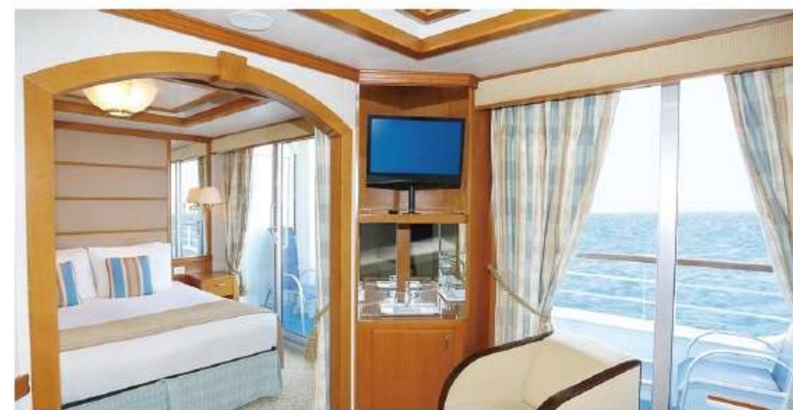
ジュニアスイート