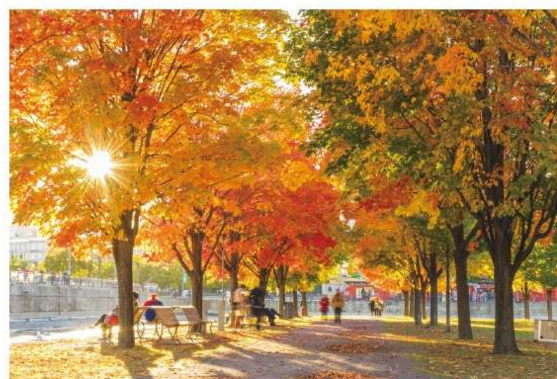
新旧の文化が融合する都市 モントリオール

セントローレンス川の中洲にある、古きフランスの面影を残す 美しい街。旧市街の重厚な石造りの建物は、まるで17世紀にタ イムスリップしたかのよう。