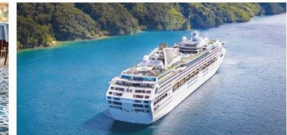
旅行代金一覧 (単位:円) ※いずれも大人お一人様旅行代金です