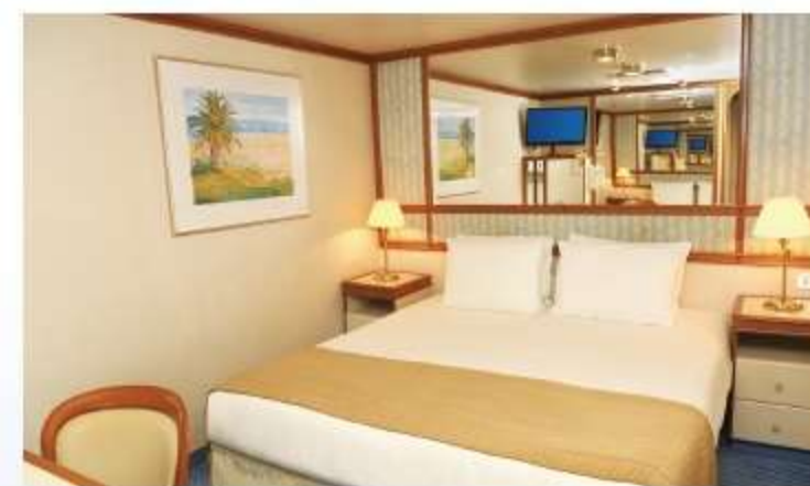
シングルエコノミー