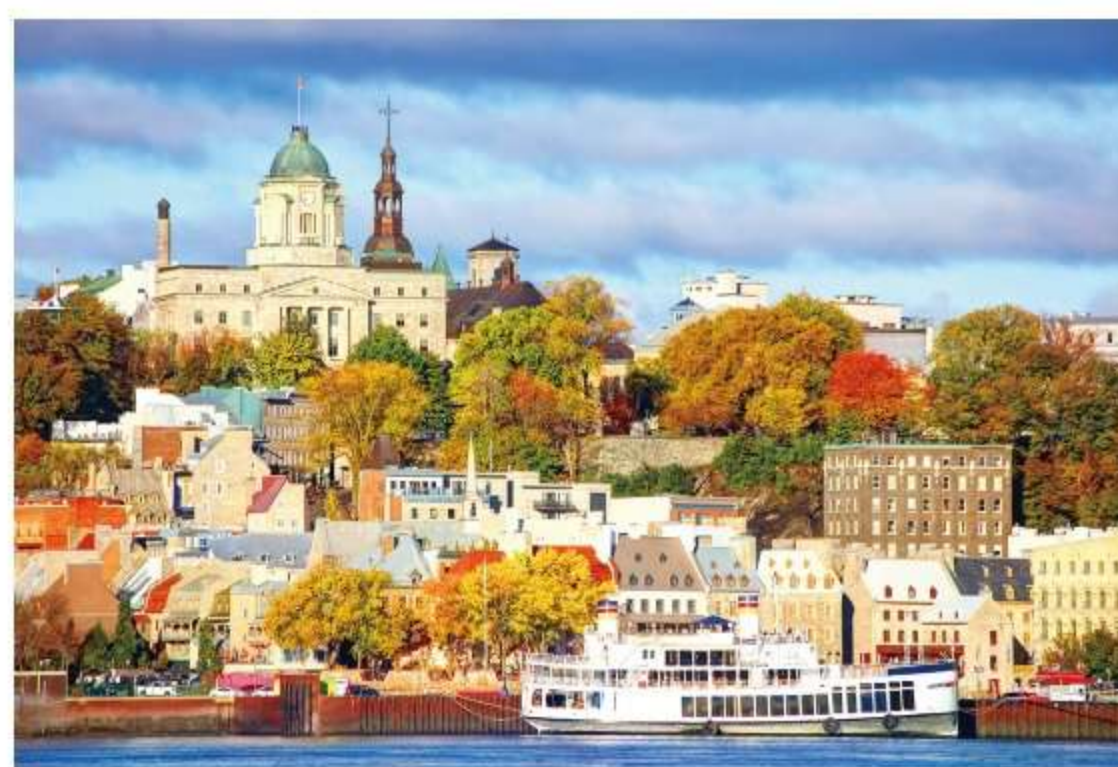
美しい古城が見守る歴史の街 ケベック・シティ

歴史的景観が色濃く残ることから、世界遺産に指定された旧 市街。北米最古の繁華街といわれるプチ・シャンプラン通りは、 どこを切り取っても絵になる佇まいです。