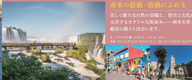
※オーバークランドツアー

左：イグアスの滝(ブラジル/アルゼンチン) 中央：ブエノスアイレス(アルゼンチン) / 右：モンテビデオ(ウルグアイ)