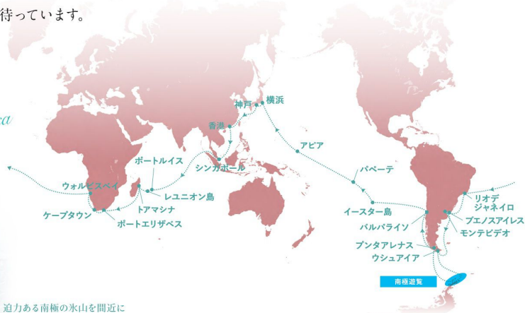
迫力ある南極の氷山を間近に

Antarctic route & Africa & South America