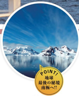
POINT! 地球最後の秘境南極へ!!

2024年12月10日(火)～2025年3月15日(土) [横浜発着96日間] 2024年12月11日(水)～2025年3月16日(日) [神戸発着96日間]