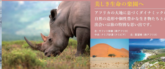
※オーバークランドツアー

左：サファリ体験(南アフリカ) 中央：ナミブ砂漠(ナミビア) 右：喜望峯(南アフリカ)