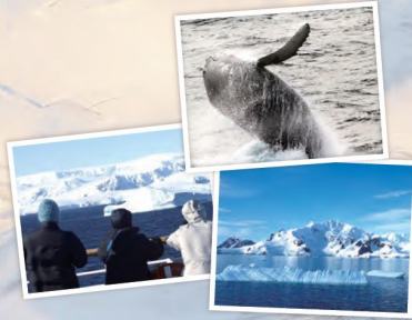
上：動物との出会いも楽しみ 左：本船で南極を遊覧 右：青と白の氷河