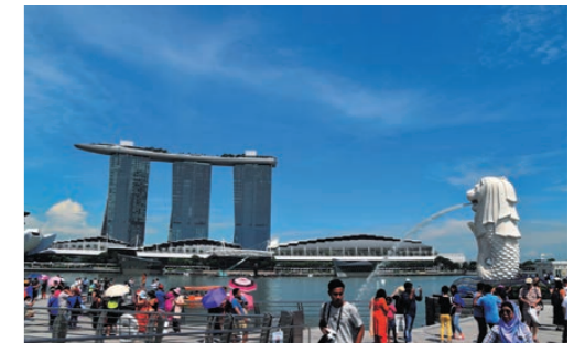
マーライオン公園

独特な単語や言い回しが特徴的なシンガポール英語「シングリッシュ」にふれ、少人数のチームごとに英語を使ったミッション(課題)に取り組みながら街歩きを楽しみます。英語力に自信がない方も同行する先生のサポートがあるので、安心してご参加いただけます。英語を使う楽しさとシンガポールの魅力が実感できるプログラムです。