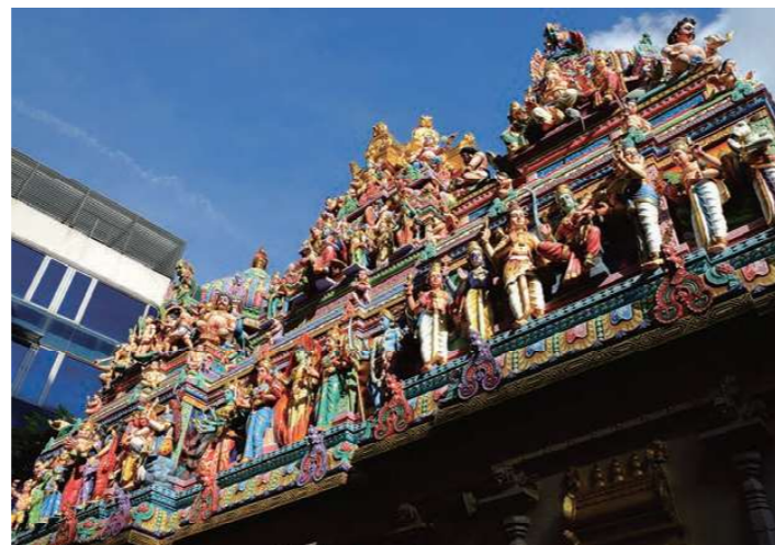
スリ・ヴィラマカリアマン寺院(リトルインディア)