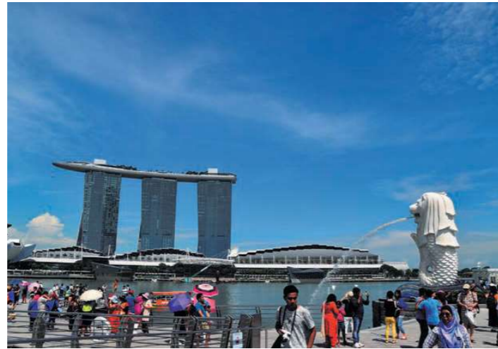
マーライオン公園

※入国審査のため、ツアーの集合時刻は11:00~13:00頃を予定しています。 ※昼食は14:00~14:30頃の開始を予定しています。