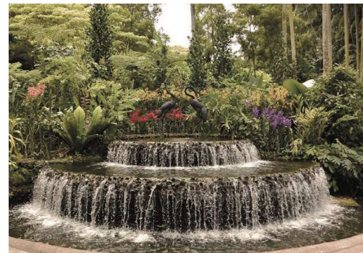
シンガポール植物園(イメージ)