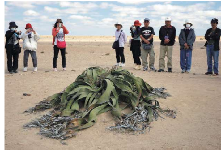
ウェルウィッチアを観察