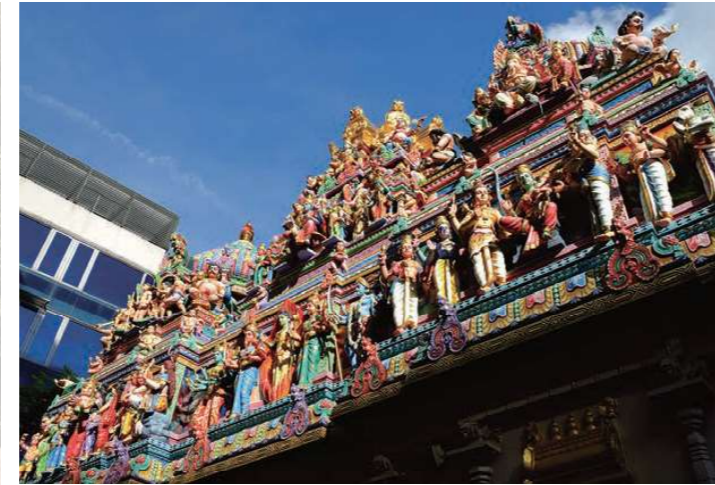
スリ・ヴェイラマカリヤマン寺院(リトルインディア)