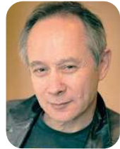
ピーター・バラカン プロードキャスター

言葉というものは、当たり前なことかも知れませんが、意思の疎通を図るための道具です。つまり、相手に通じなければ役に立たないといえます。まじめに構えずに完璧な英語を目指すよりもむしろ簡単な単語を素朴に並べながら自分の気持ちを真剣に伝えようとする方が効果的な場合が多いかと思えます。ただ、カタカナ発音の英語が通じないという事実を認識することは大切です。