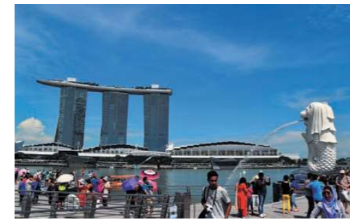
マーライオン公園

※入国審査のため、ツアーの集合時刻は11:00~14:00頃を予定しています。 ※昼食は14:30~15:00頃の開始となる場合があります。