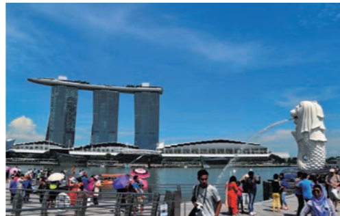
マーライオン公園

※入国審査のため、ツアーの集合時刻は9:00~12:00頃を予定しています。 ※昼食は14:30~15:00頃の開始となる場合があります。