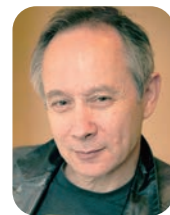
ピーター・バラカン ブロードキャスター

言葉というものは、当たり前のことも知れませんが、意思の疎通を図るための道具です。つまり、相手に通じなければ役に立たないといえます。まじめに構えずに完璧な英語を目指すよりむしろ簡単な単語を素朴に並べながら自分の気持ちを真剣に伝えようとする方が効果的な場合が多いかと思います。ただ、カタカナ発音の英語が通じないという事実を認識することは大切です。