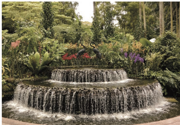
シンガポール植物園(イメージ)