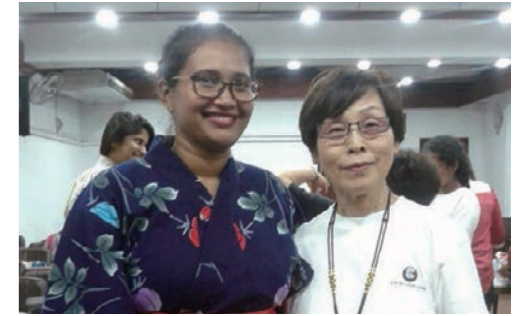
地元の学生たちと“英語で”交流(イメージ)

地元の学生から、スリランカの伝統ダンスや食事の文化を教わったり、折り紙や習字など日本の文化を伝えたり、洋上で学んだ英語を使って交流します。身振り手振りも交えた英語でのコミュニケーションの楽しさや、地元の人びとの笑顔は、大切な思い出となるでしょう。