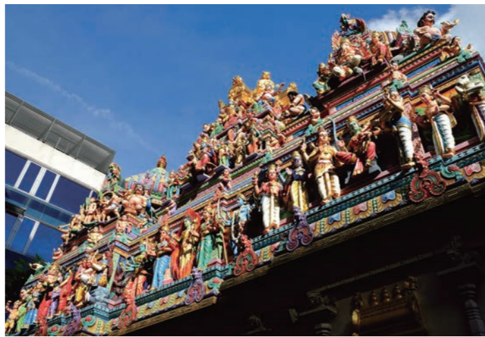
スリ・ヴィラマカリアマン寺院(リトルインディア)