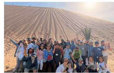
大砂丘をバックに

※小型~大型バスに分乗となります。また、車両にはマイクや冷房設備がない場合もあります。ジャパングレイス社員やピースポートスタッフは同乗せず、車中では英語のご案内となります。