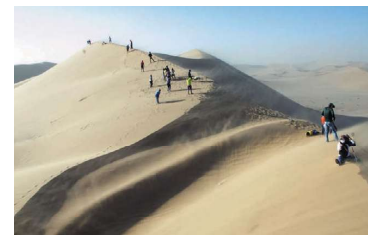
ウォルビスベイ/大砂丘(イメージ)