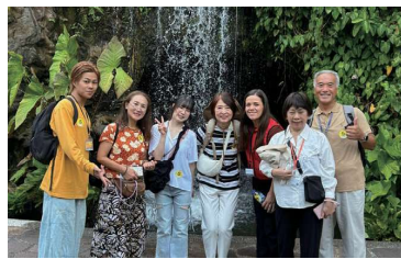
シンガポール植物園