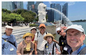
マーライオン公園

※入国審査のため、ツアーの集合時刻は9:00~12:00頃を予定しています。 ※昼食は14:30~15:00頃の開始となる場合があります。